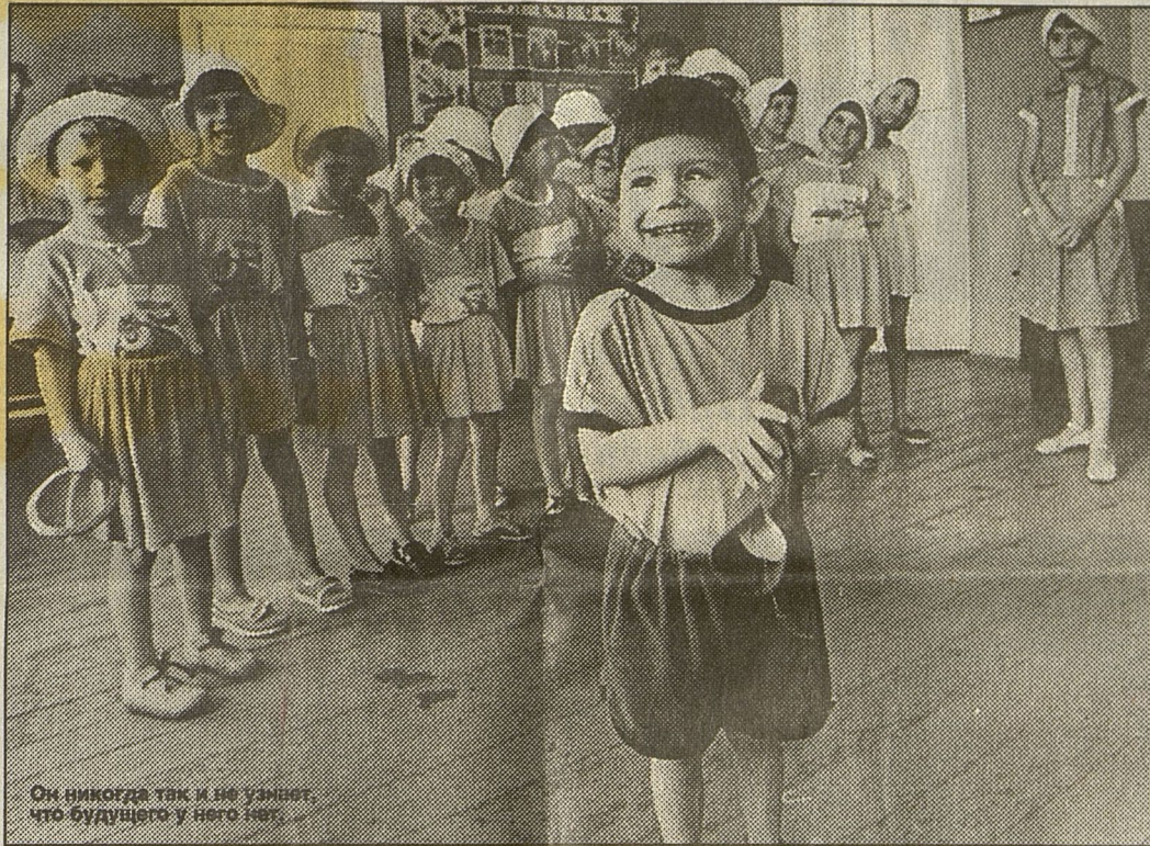
Он никогда так и не узнает, что будущего у него нет.

Таких, бывает, берут обратно домой родители. А большинство обречено на судьбу трагичную. Их передают в психоневрологические интернаты для престарелых. Какая там писанина, чтение... Существование теряет даже призрачный смысл. Кто хоть чуточку светлее, бегут