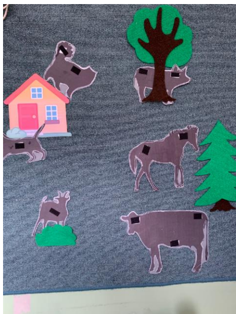
Рис.1. До помощи детей