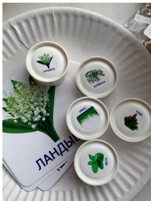
Рис.3. Аромолото и карточки