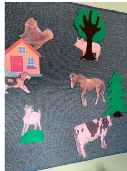
Рис.2. После помощи детей