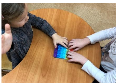
Рис.5 «Кто быстрее»

Играют двое. Поле делится на две равные части по три ряда каждому игроку. По сигналу игроки начинают одновременно «хлопать» кружочки. Выигрывает тот, кто первым закончит.