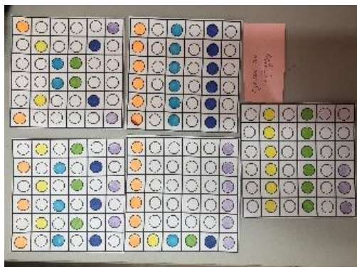
Рис.3 «Повтори узор»

воспроизвести образец на другом поле. Усложнение: повторить узор с той же последовательностью нажатий, что и взрослый.