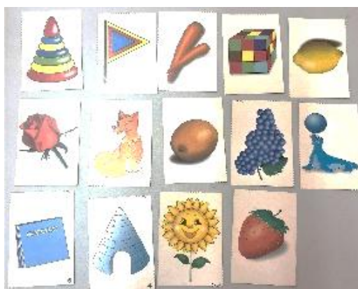
Рис.1 «Найди предмет такого же цвета»

2-й вариант: педагог или родитель сначала предлагает ребенку нажать на кружок какого-либо цвета, а затем подобрать картинки того же цвета – например, красный помидор, красная футболка, красный мяч и назвать их.