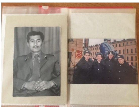
Фото 15,16,17,18 Наш альбом