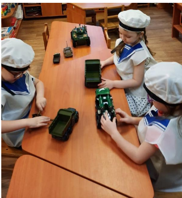
Фото 1,2,3 Рассматривание иллюстраций и военной техники