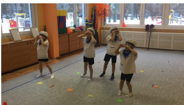
Фото 9,10,11,12,13,14 Досуг