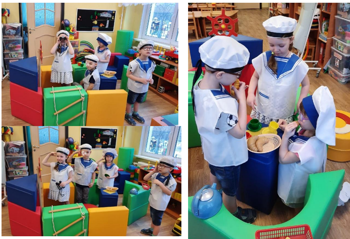
Фото 4, 5,6,7,8 К плаванию готовы