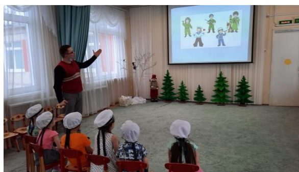
Фото 18,19,20,21,22,23,24 Образовательное событие

Так закончилась неделя детской инициативы «Кто такие защитники Отчизны?».