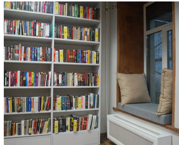
на мягком подоконнике