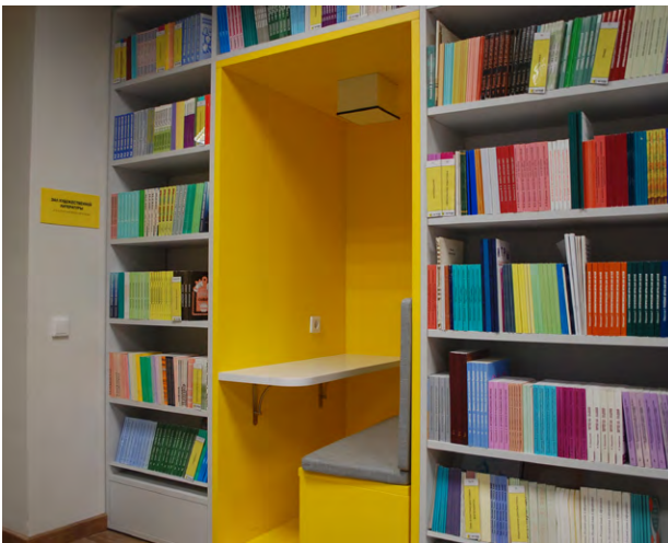
в нише с индивидуальным освещением